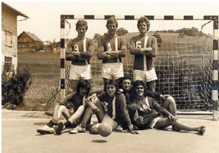
Slika 6: Rokometna tekma v Šmarju-Sap, 25. 5. 1972