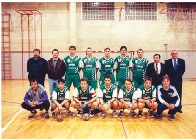
Slika 27: Ekipa v sezoni 1998/1999

V sezoni 97/98 je RK Škofljica dosegla v 1. A državni ligi 11. mesto in samo za točko padla v nižji rang tekmovanja, v katerem pa je tekmovala samo še v sezoni 98/99. Po tej sezoni je članska ekipa prenehala s tekmovanjem.