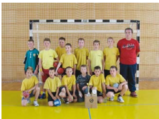
Slika 37: Ekipe mlajši dečki B