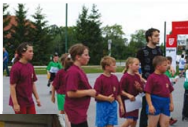
Slika 44: Mini rokometa s prireditve Igram rokometa in plešem 2009