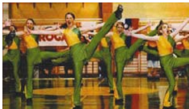
Slika 47: Frklje, tekmovalna ekipa 2001

In res. Od takrat naprej je šla pot plesalk Frkelj strmo navzgor. Za seboj imajo vrsto nastopov, kvalifikacij, tekmovanj, tudi v tujini, celo dve plesni predstavi; Skozi letne čase (2002) ter S plesom okoli sveta (2003).