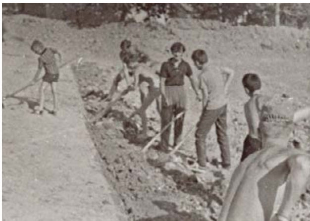
Slika 1: gradnja igrišča v Pevčevi dolini

Pri stari opekarni, ki je stala na mestu, kjer je zdaj vrtec, so ravno podirali dimnik in na tem mestu se je začelo graditi prvo rokometno igrišče na Škofljici. Fantje so kopali, nasipali in utrjevali igrišče jalovino iz barita. Delali so vse leto.