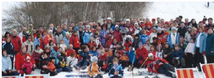
Slika 34: Občinsko tekmovanje v veleslalomu leta 2006

ŠD Škofljica je vsakoletni organizator tradicionalnega občinskega tekmovanja v veleslalomu.