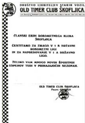
Slika 25: čestitke rokometašem

Potrebno je vedeti, da je ekipa delovala pod nemogočimi pogoji. Tekmovanje na zunanjih igriščih ni bilo več dovoljeno, športne dvorane pa seveda na Škofljici ni bilo. Treningi in tekme so se odvijale v športni dvorani Poljane v Ljubljani.