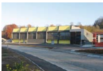
Slika 57: Zunanost večnamenske dvorane

Z novim športnim objektom smo dobili idealne priložnosti za nadaljnji razvoj rokometu in ostalih aktivnosti. Večnamenska dvorana je dopadljivega videza in sodobno zasnovana, z vso potrebno infrastrukturo in tudi s tribunami za do 500 gledalcev.