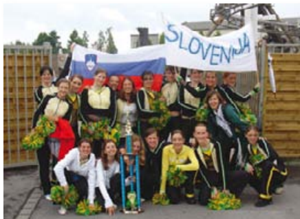
Slika 48: Frklje, tekmovalna ekipa Nemčija 2005