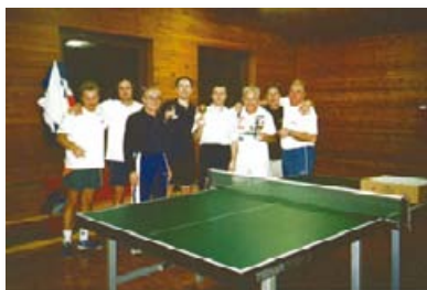
Slika 33: Leto 2002: občinsko tekmovanje v namiznem tenisu

Društvu se je pod vodstvom Irene Balažic leta 2001 pridružil še ples in nekaj kasneje tudi rekreacija.