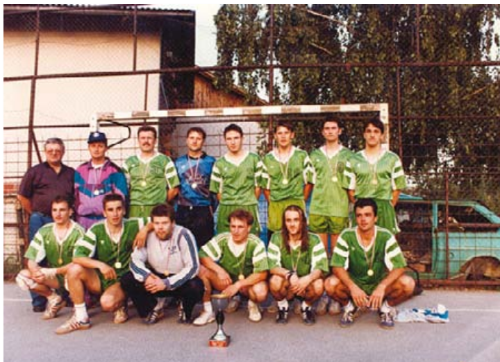
Slika 21: Prvaki 3. državne lige

prvo mesto in se uvrstila v drugo državno ligo. V tem obdobju sta se v vodstvo kluba aktivno vključila Branko Koban in Ive Juričev.