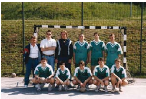
Slika 29: Sezona 1998/1999 kadeti