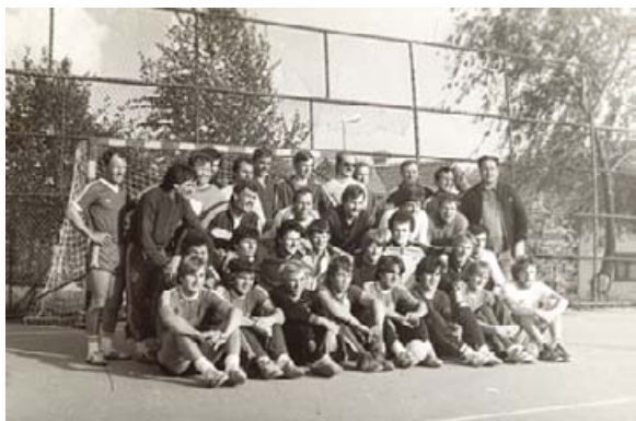
Slika 16: Turnir generacij