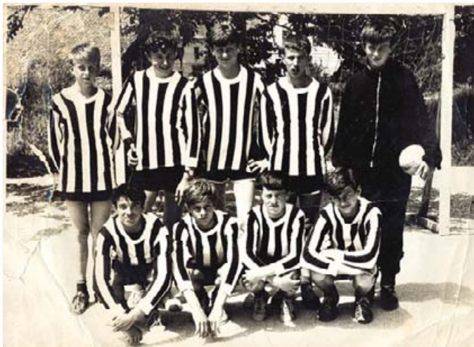
Slika 5: Občinski prvaki v rokometu, Lj-Vič-Rudnik, 1968

Do leta 1976 so ekipe osnovne šole Škofljice redno posegale po najviših uvrstitvah na rokometnih šolskih tekmovanjih, nemalokrat so bili občinski in tudi medobčinski prvaki.